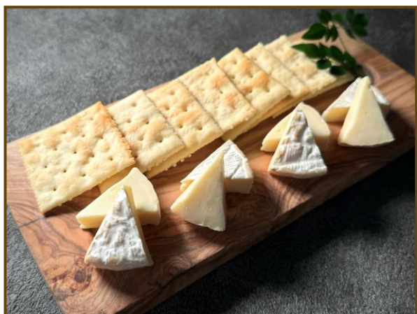
カマンベールチーズ