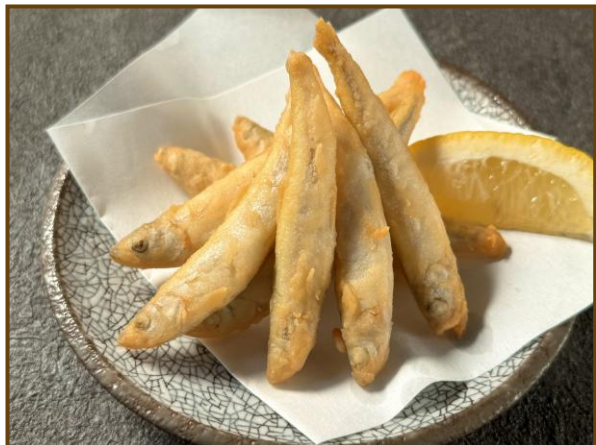
ワカサギフリット