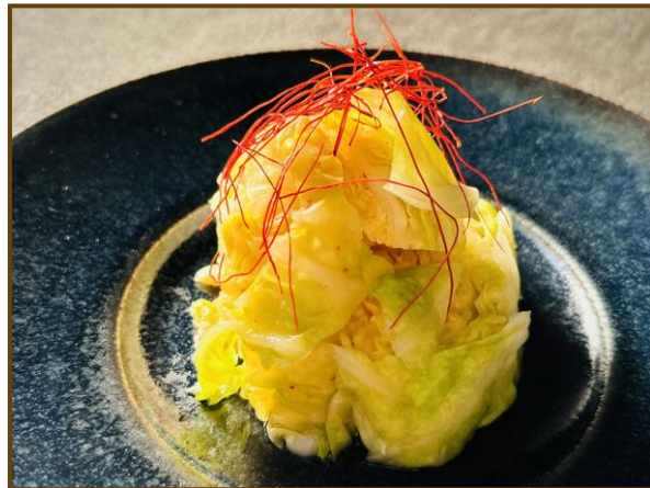
ハルピンキャベツ